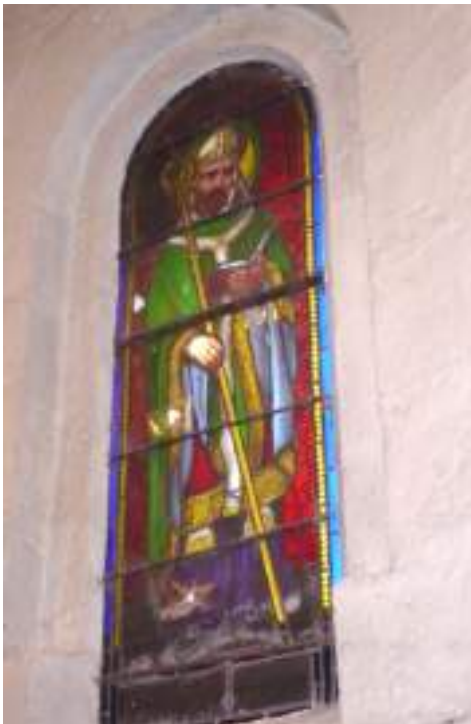
Vitrail de Saint Maurille

Le saint présente un visage jeune et barbu. Il tient d'une main son bourdon de pèlerin complété d'une gourde, et présente de l'autre sa devise : (Tu) ERIS IN PESTE PATRONUS. Le personnage nimbé se détache sur un fond bleu vif à bordure ornée. Le reste de la verrière est composée d'une résille noire fleurie sur fond blanc ourlée de bordures colorées bleue et rouge.