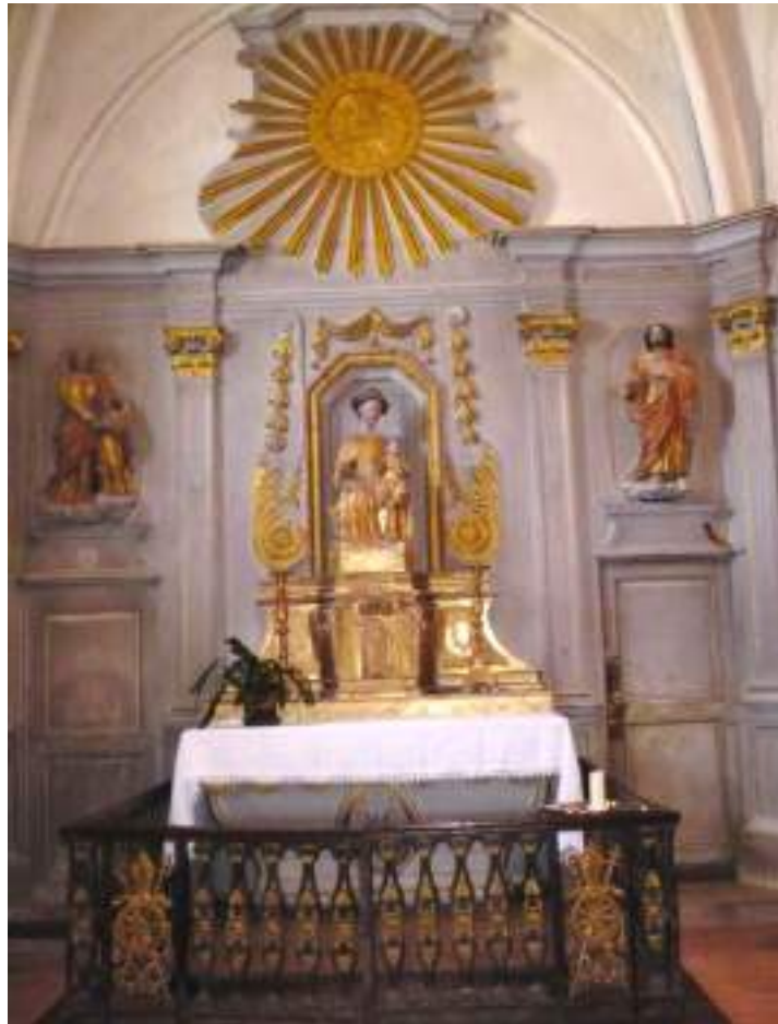
Chapelle de la Vierge