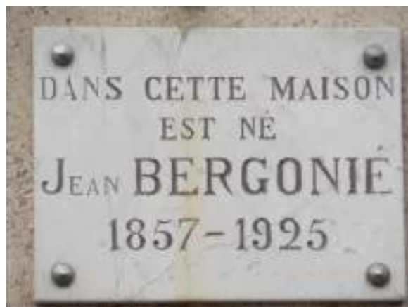
Maison natale de Bergonié