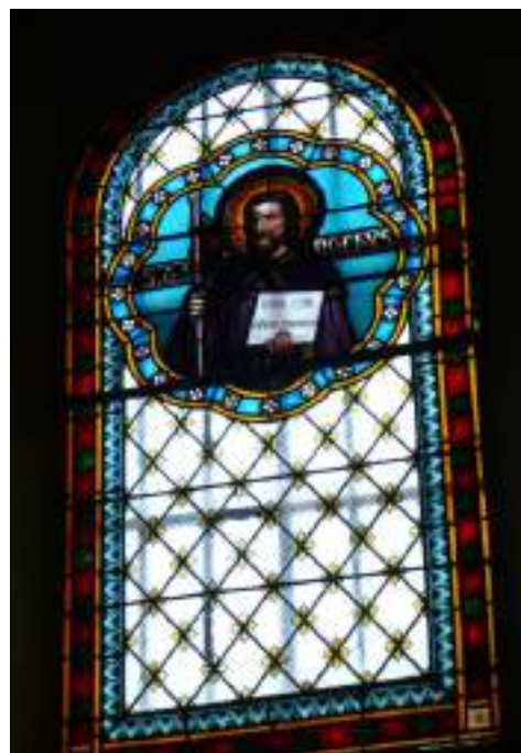
Vitrail de Saint Roch