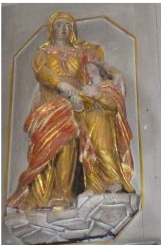
Sainte Anne et la Vierge