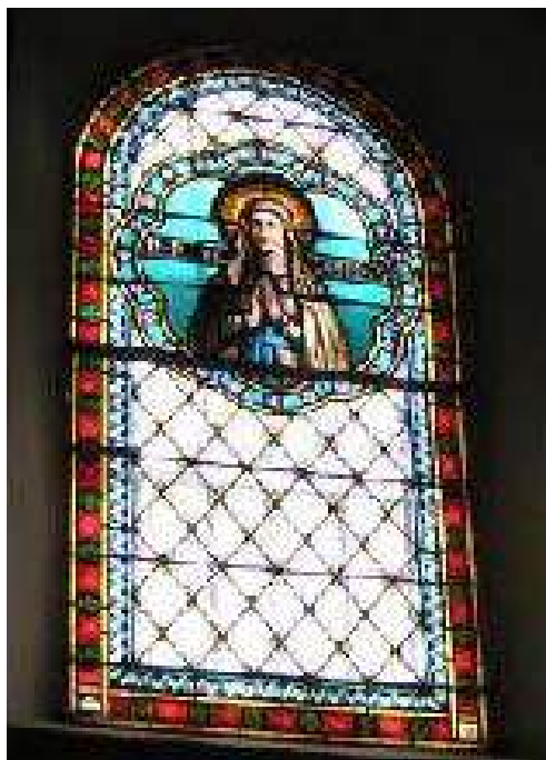
Vitrail de la Vierge