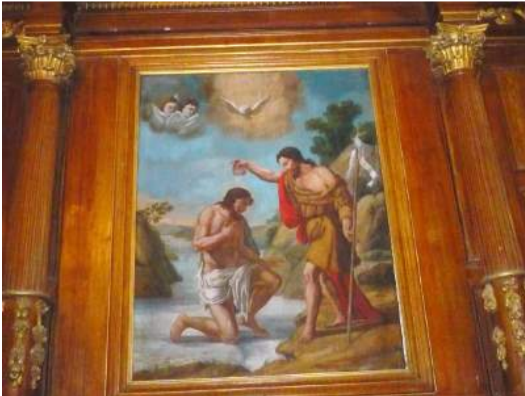
Fonds baptismaux – peinture sur toile du retable