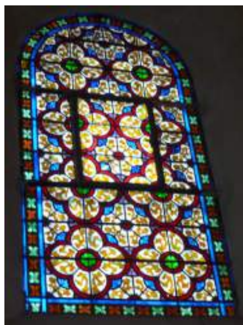
Autres vitraux aux motifs géométriques et floraux