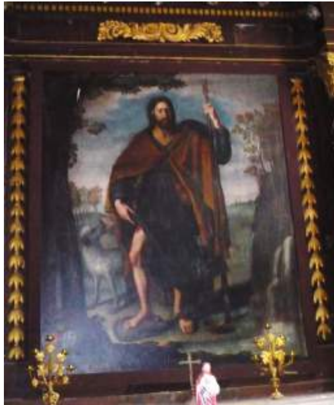
Peinture sur toile du retable, Saint Roch - 1720 - Sibon