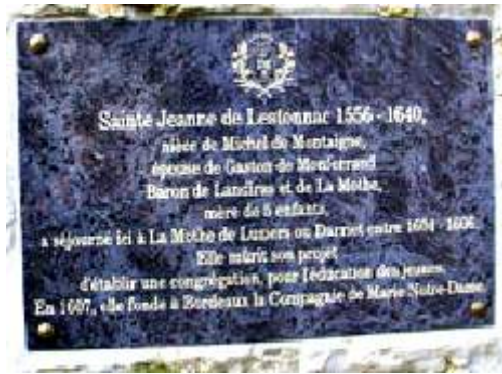
Plaque en marbre apposée sur le mur du moulin de Luzier