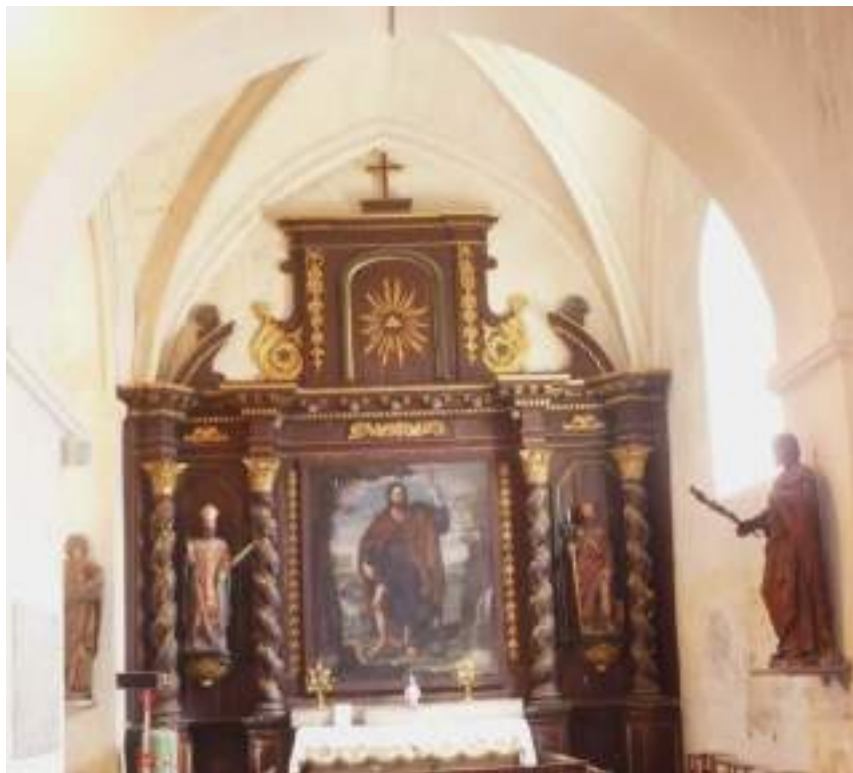
Retable de la chapelle Saint-Roch

Le retable date probablement de la seconde moitié du XVIIIe siècle. Il se compose d'un socle élevé jusqu'à la hauteur de l'autel. Au-dessus de ce socle quatre colonnes torsées ornées de pampres et terminées par des chapiteaux corinthiens entourent deux statues placées sur des culs-de-lampes à feuilles d'acanthe. Au-dessus de l'autel un grand cadre (1722 – Cl. M.H 28/03/1969) occupe le compartiment central. Un entablement important orné de rinceaux et d'une corniche aux moulures vigoureuses couronne la composition et forme saillie au-dessus des quatre colonnes. Au troisième niveau un demi-fronton cintré est interrompu par un panneau rectangulaire flanqué de volutes et orné en son centre du triangle de la trinité. Une simple croix somme l'ensemble.