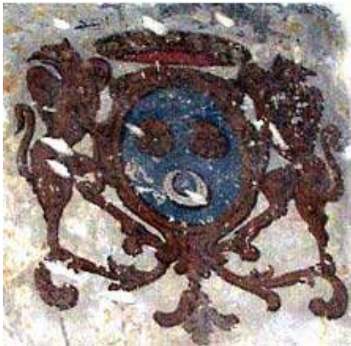
Litre avant restauration

Le conservateur de la DRAC a décidé de masquer à nouveau ces imperfections (coulures datant du XVIIIème siècle).