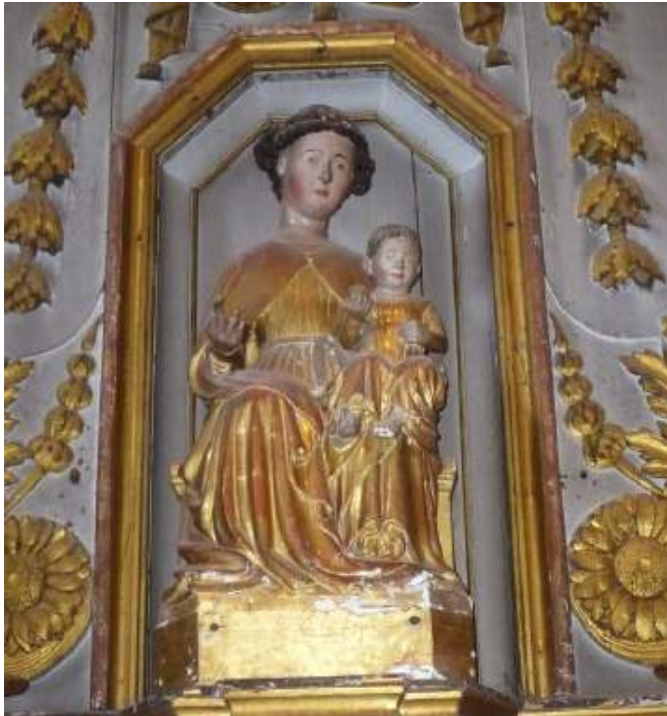
Vierge à l'enfant