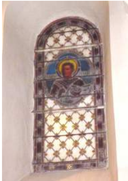
Vitrail de Saint Jean