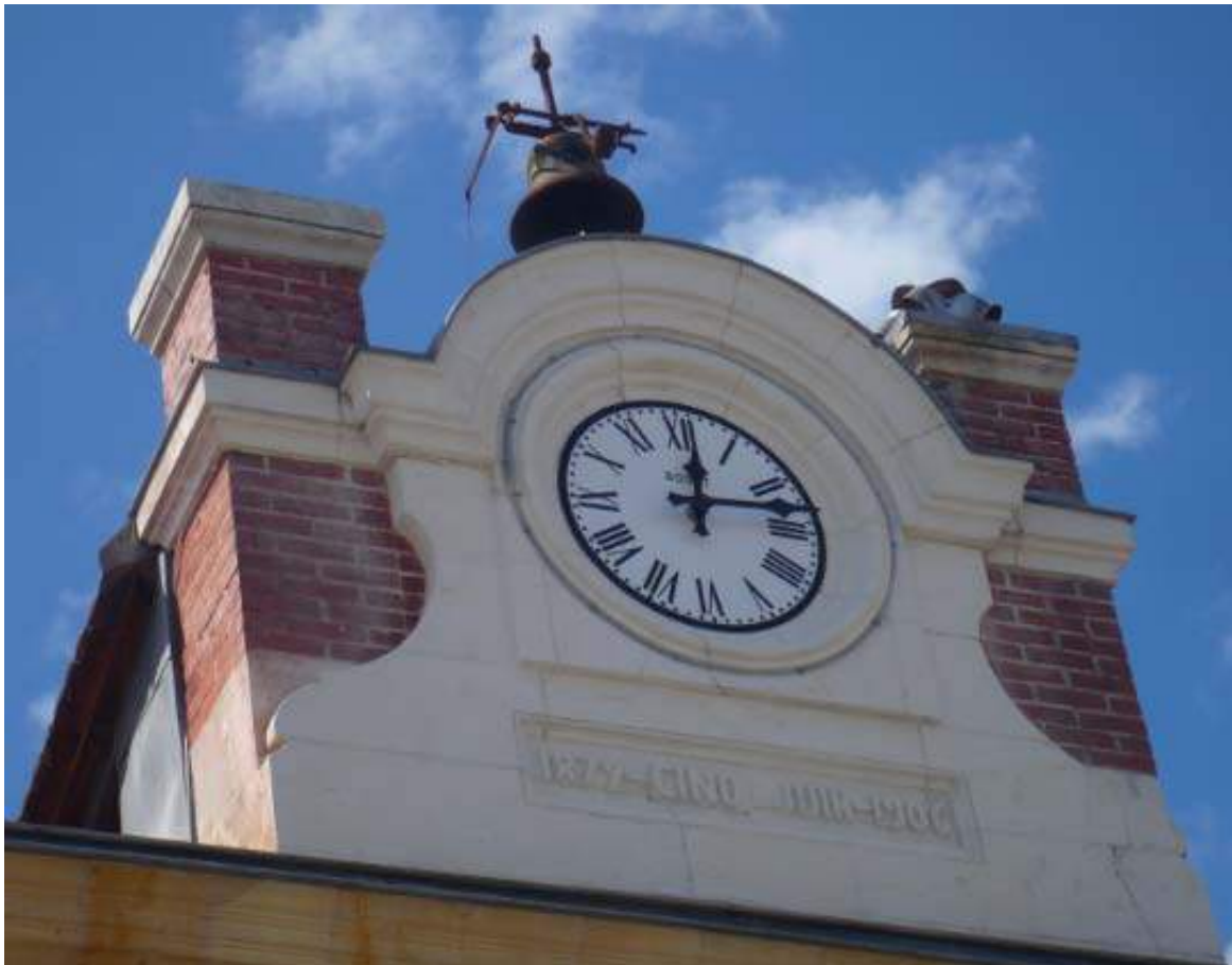
Horloge de la mairie