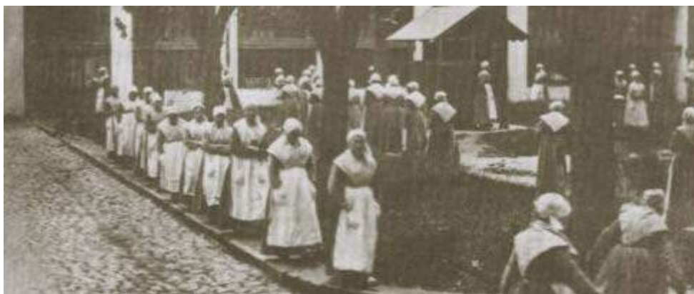
Maison de force de Cadillac en 1864