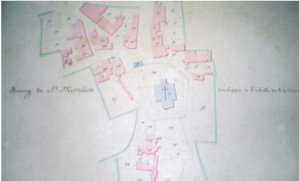
Saint Morillon en 1858 : on peut remarquer que l'ancienne mairie est appuyée sur le mur du cimetière