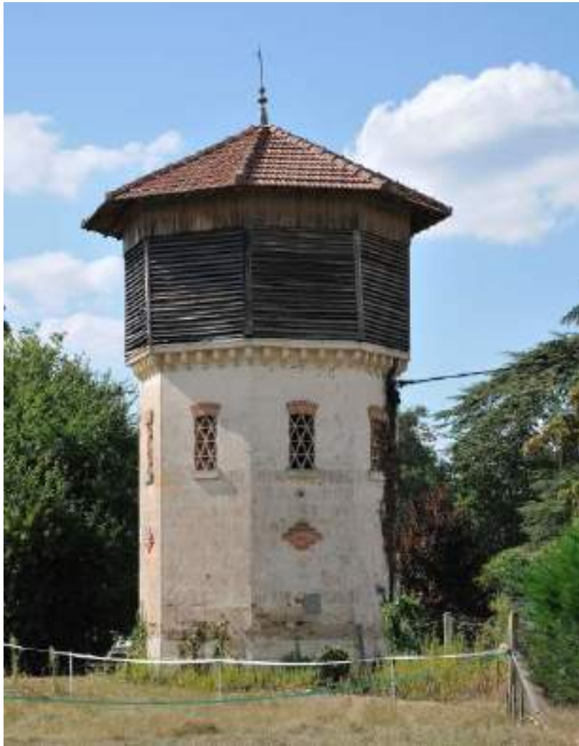
PIGEONNIER DU DOMAINE DE LAGULOUP