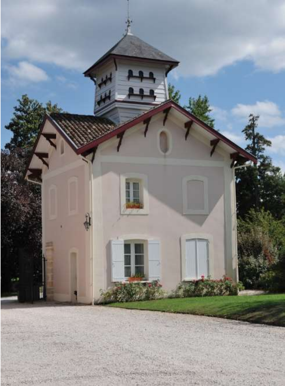
PIGEONNIER DU CHATEAU LEOGNAN