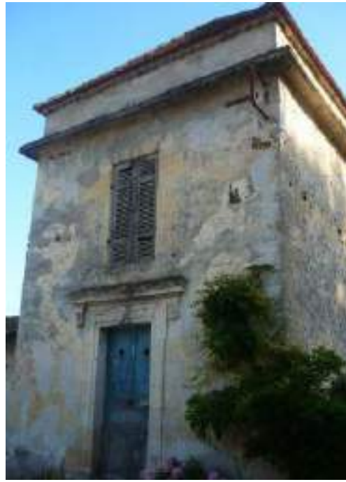
Château de La Brède - pigeonnier - tour isolé Domaine de Lartigue - pigeonnier accolé à base carrée (Saint-Médard-d'Eyrans)