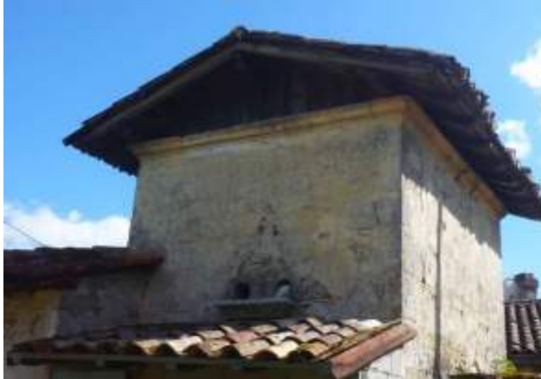
Pigeonnier du Château Belon (Saint Morillon)